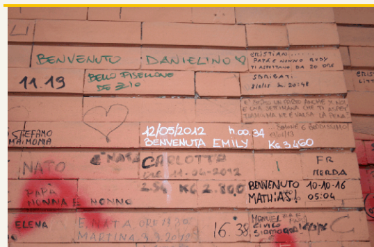
(foto scattata presso il reparto di Ostetricia e Ginecologia, Ospedale San Camillo, Roma)

Simeone Latini, 47 anni, attore, regista e autore cagliaritano. Da 25 anni si divide tra teatro, cinema e tv, in Italia e all'estero. Da qualche tempo è tornato a vivere in Sardegna, terra di grande bellezza, ma anche di profondo disagio sociale, tema ricorrente nei suoi lavori.